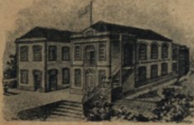
AS NOVAS OFFICINAS

Premiado com um GRAND PRIX na Exposição Internacional de Louvain